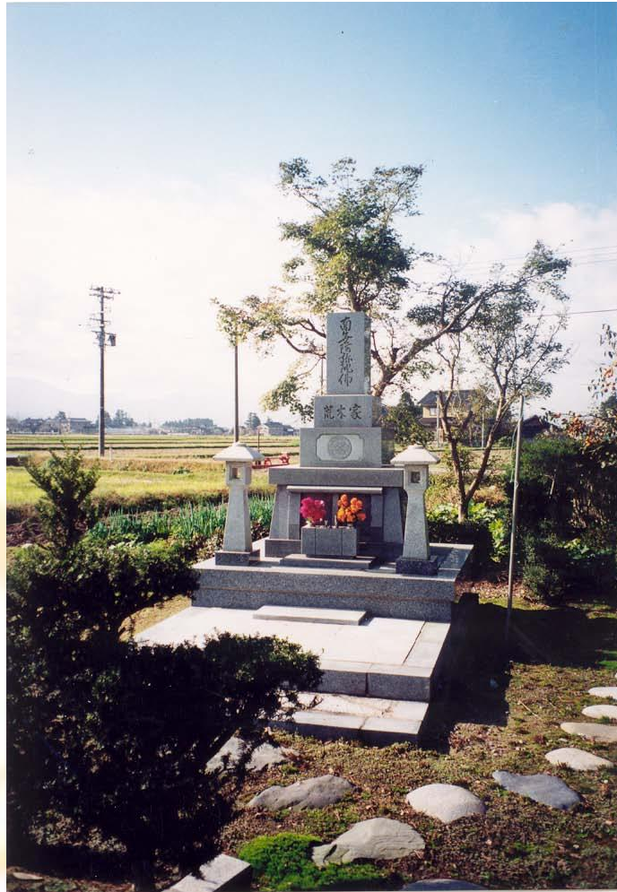
1. ábra. Egy japán tanyatelek sarkában elhelyezkedő kis temető Tonamiban

Japánban azon túl, hogy az idősek tisztelete is nagyon jellemző az egész társadalomra, a halottak sírjait is többször felkeresik minden évben. Az egész népnek erőt adó történelmi múlt tehát úgy is „benne gyökerezik” a japánokban, hogy egy-egy ilyen emléknapon, mint a halottak napja, felkerekednek, elmennek a temetőkbe és az ősökre emlékeznek. A ma már teljesen urbanizált országban általában a vidéki templomok, szentélyek mellett vagy éppen a Fuji-hegy oldalában található a zsúfolt kis temetők a családi emlékkövekkel. Halottak napján tehát szinte az egész ország útra kel. Akárcsak nálunk. Kérdés, hogy nálunk is ad-e esetleg új erőt ez a cselekvés a jövőhöz? Mert bár nálunk a történelmi múlt nem kevésbé eseménytelen, mint ott, Japánban, mégsem tudunk igazán megbékélni vele, s hozzájuk hasonlóan sajátosan hitet és erőt meríteni belőle. Családi és közösségi alapon is. Tudom, Maguk kedves hallgatóim még nagyon fiatalok. Ezért ritkábban foglalkoznak efféle kérdésekkel. Pedig fontosak. Majd, ha „öregszenek” meglátják, az élet része a halál. Az emlékezés pedig a jövő jobb megalapozásához szükséges. Mert csak akkor lehetünk sikeresek, ha érezzük és tudjuk, egy „folyamatban” vagyunk. Őseink nyomán (maguk esetében még leendő 😊) gyermekeink és unokáink érdekében.